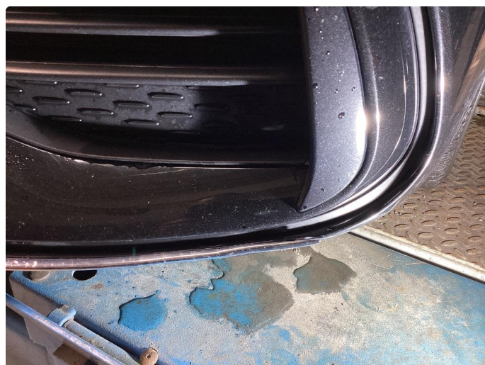
1.3 Øvrige feil