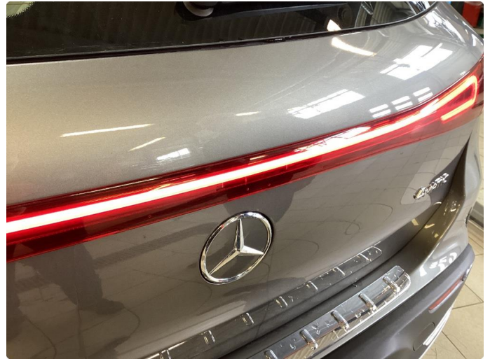
2.1 Øvrige feil