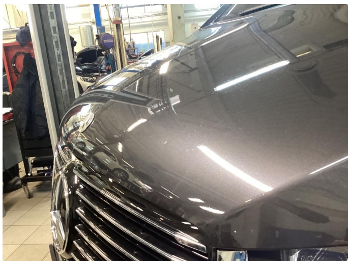
1.1 Bulk med lakkskade