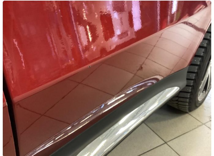
1.1 Noe steinsprut