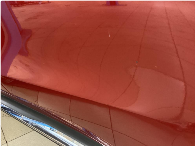
1.1 Noe steinsprut