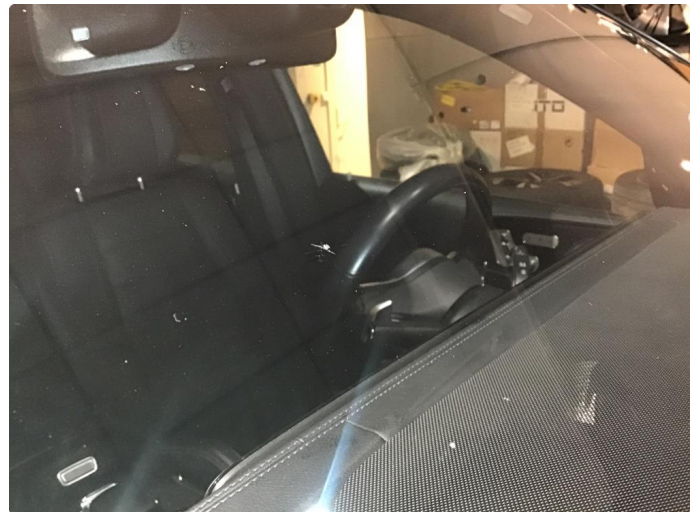
1.4 Steinsprut reparert