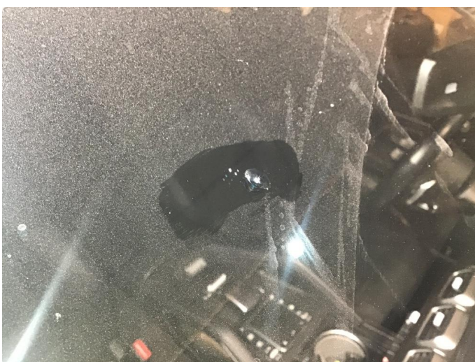
1.4 Steinsprut reparert