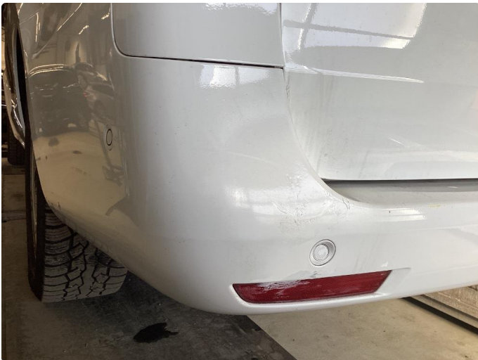
1.3 Små riper på støttfanger bak