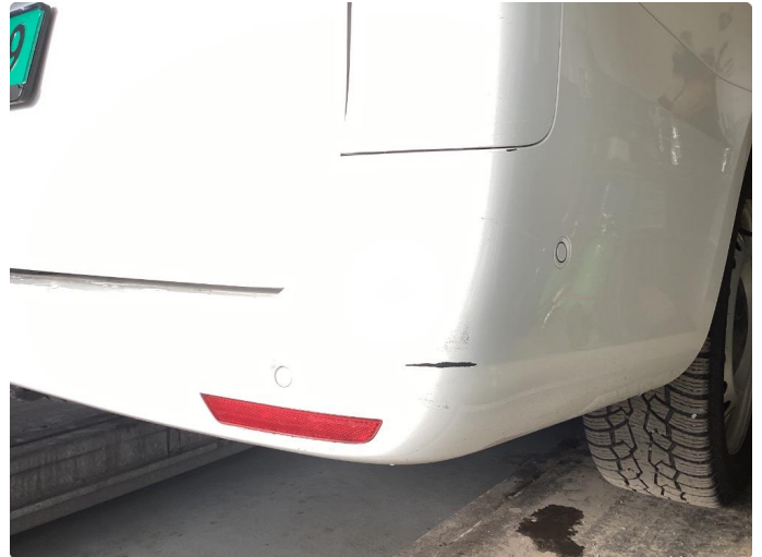
1.3 Små riper på støttfanger bak