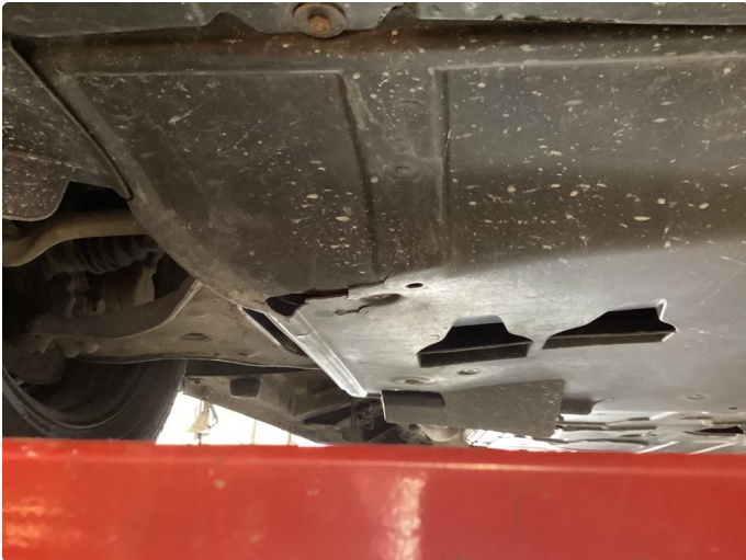
1.1 Beskyttelsesplate skadet/mangler