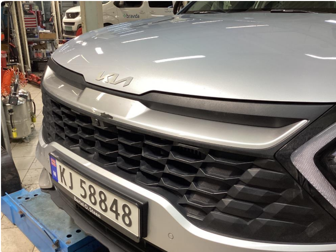
1.1 Lakk flasser