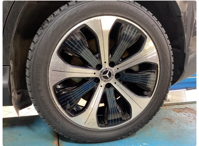
1.2 Betydelig oksidering