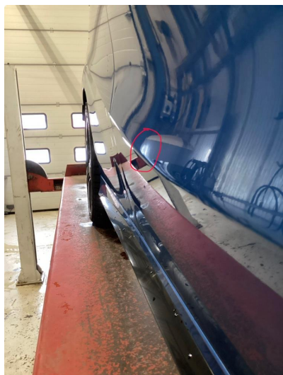
1.1 Liten parkeringsbult uten lakkskade