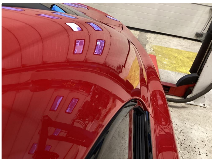
1.2 Liten parkeringsbukk - uten lakkskade.