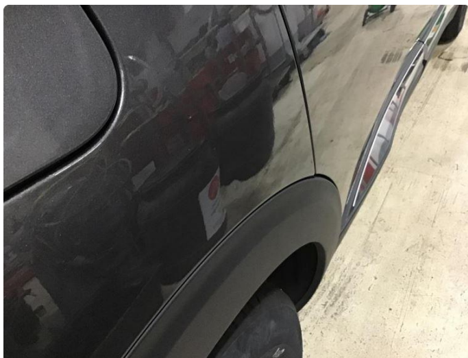
1.1 Liten parkeringsbult