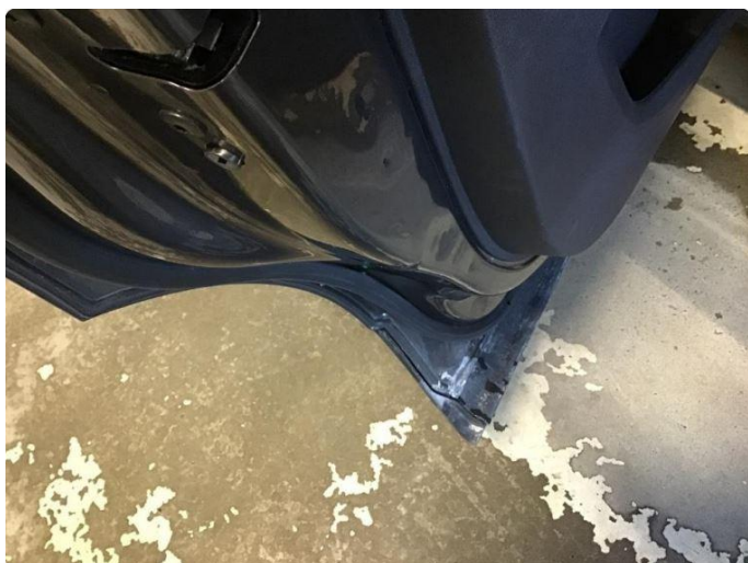
1.2 Bulk/riper etter sikkerhetsbelte. Kun kosmetisk.