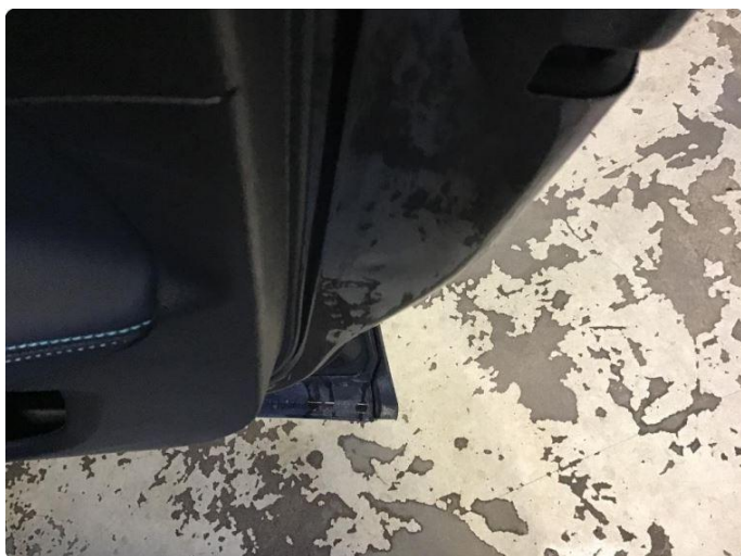
1.2 Bulk/riper etter sikkerhetsbelte. Kun kosmetisk.