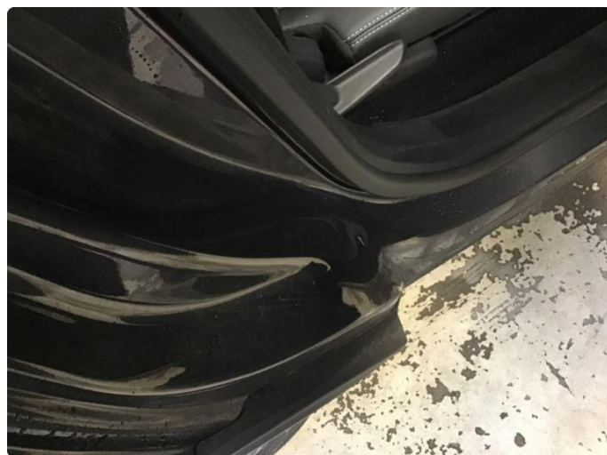
1.2 Bulk/riper etter sikkerhetsbelte. Kun kosmetisk.