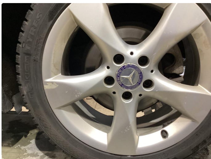
1.5 Kantskjørt felg