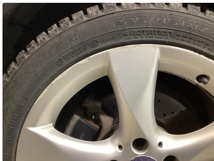
1.5 Kantskjørt felg