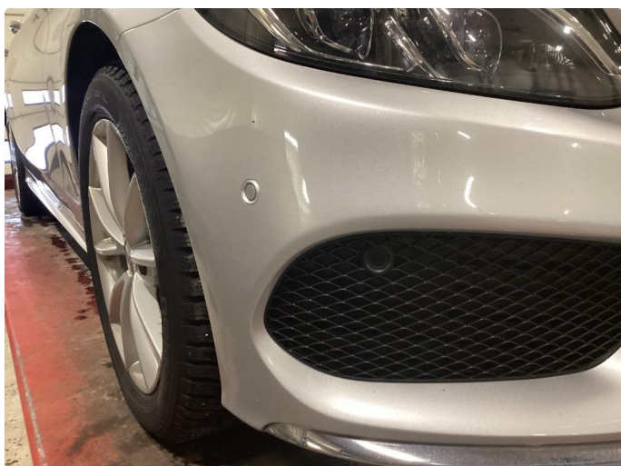
1.1 Noen steinsprang