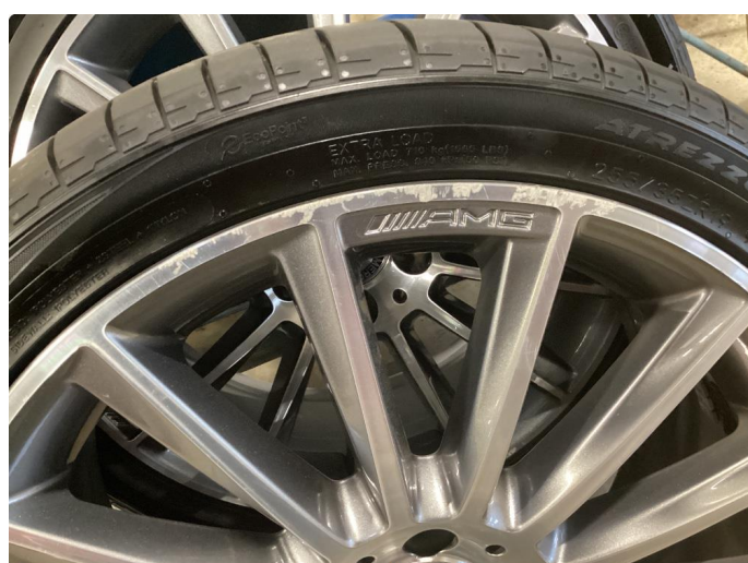
1.2 Kantkjørt felg(er)