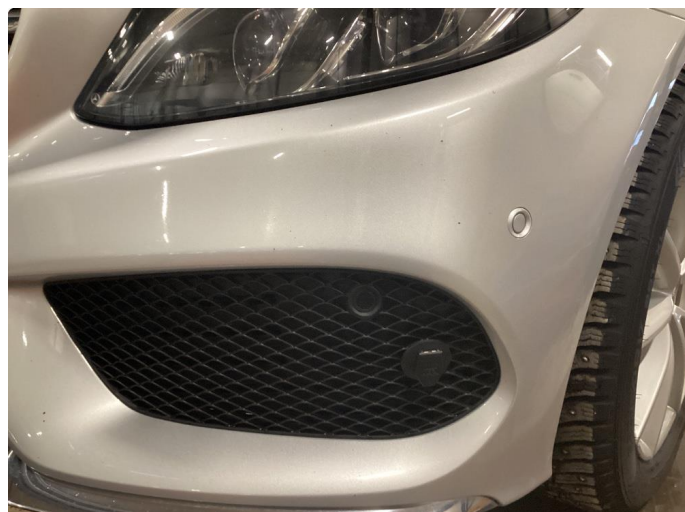
1.1 Noen steinsprang