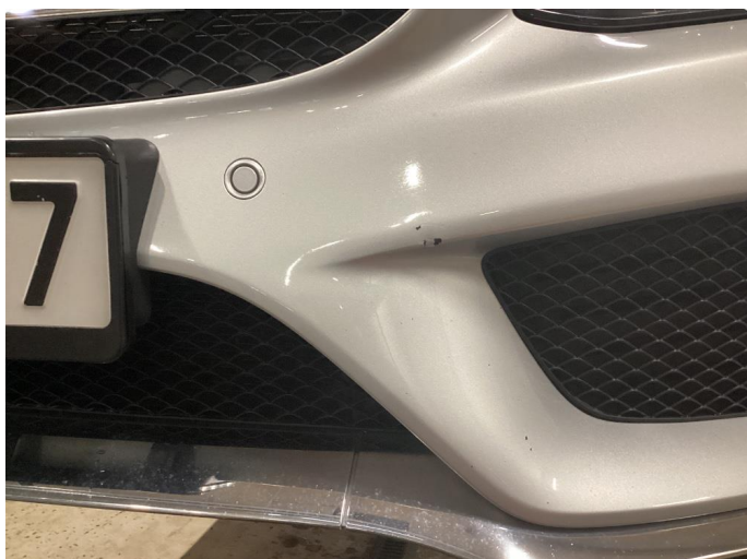
1.1 Noen steinsprang