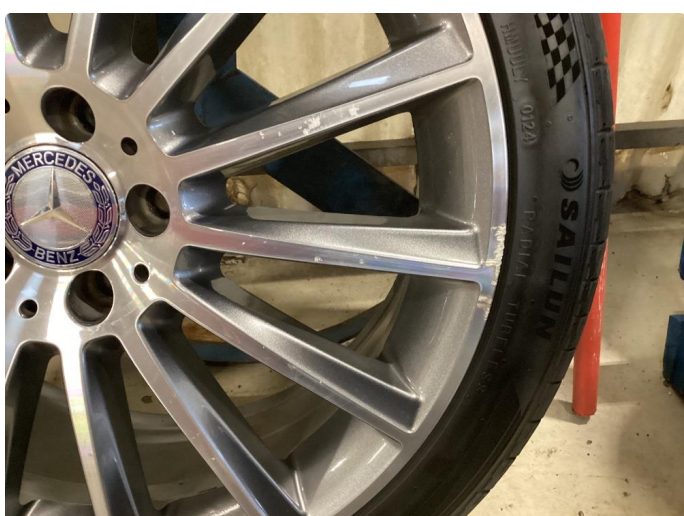
1.2 Kantkjørt felg(er)