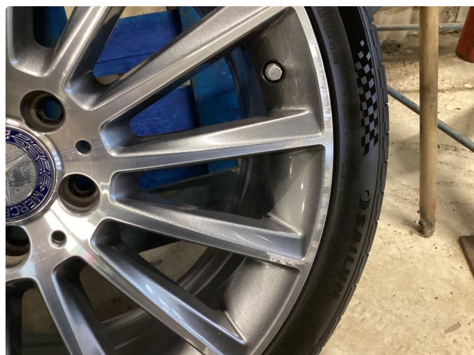
1.2 Kantkjørt felg(er)