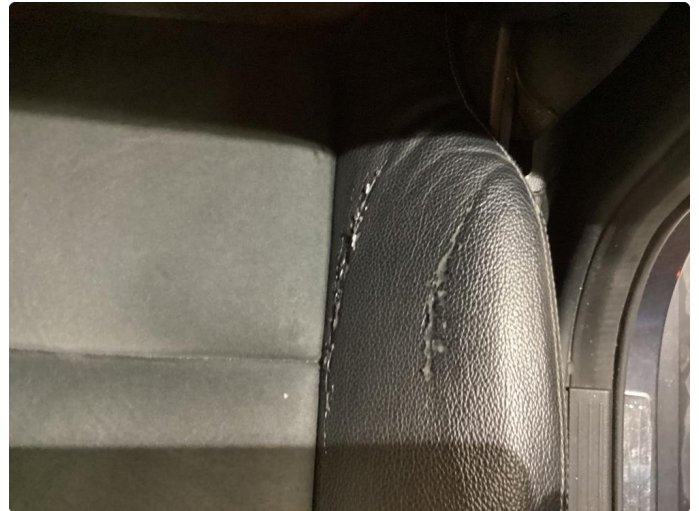
2.1 Skade på setepute