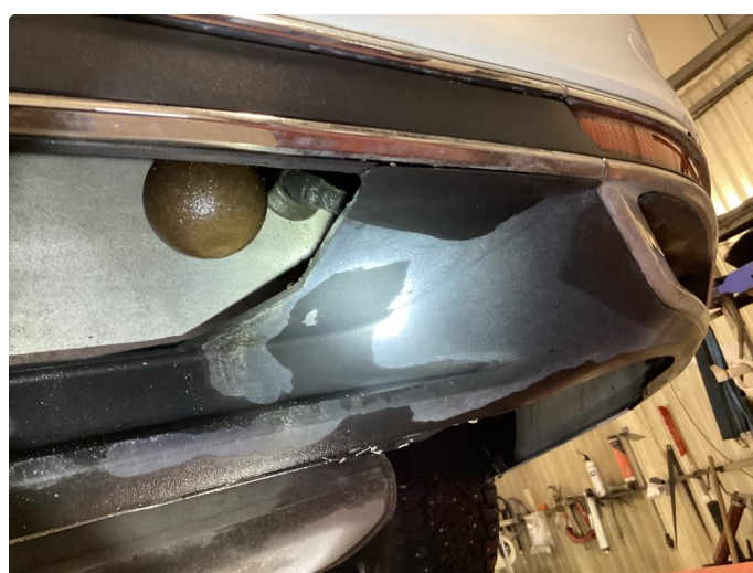
1.6 Skade i plast