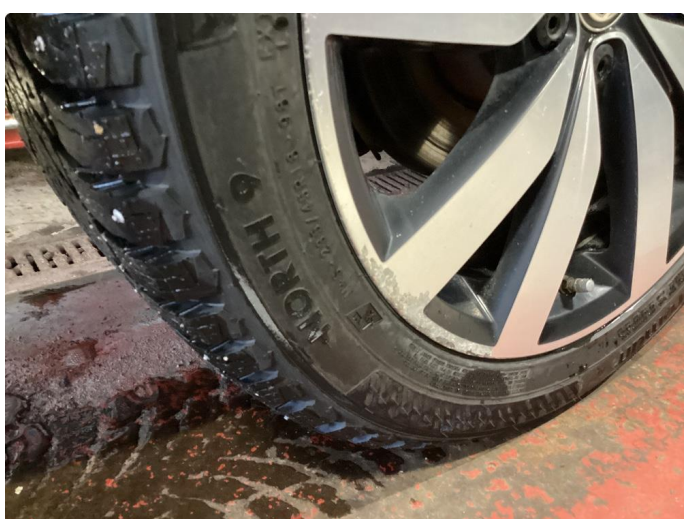
1.5 Kantkjørt felg