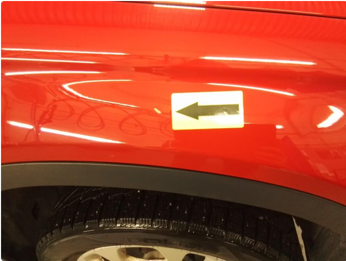
1.1 Litt lakk avflassing høyre forskjerm