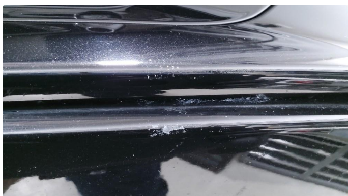
1.2 Liten ripe - Normal slitasje - Flikkes