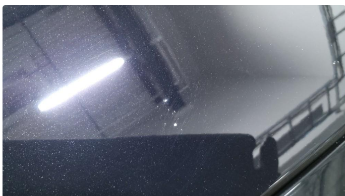
1.1 Noen få steinsprang - Normal slitasje - Flikkes