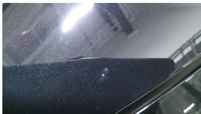
1.1 Noen få steinsprang - Normal slitasje - Flikkes