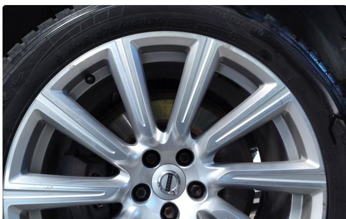
1.2 Påbegynnende oksidering