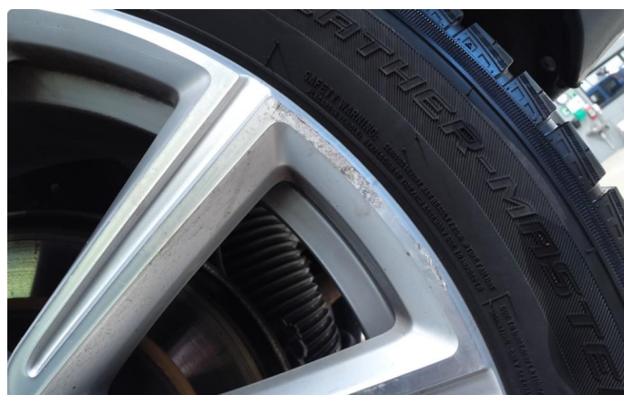
1.2 Påbegynnende oksidering