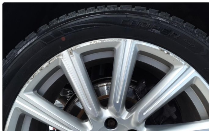
1.2 Påbegynnende oksidering