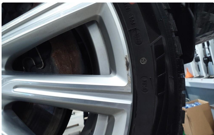
1.2 Påbegynnende oksidering