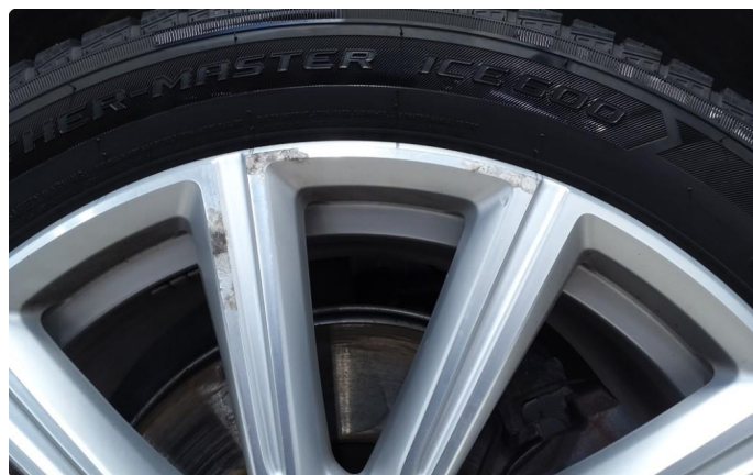
1.2 Påbegynnende oksidering