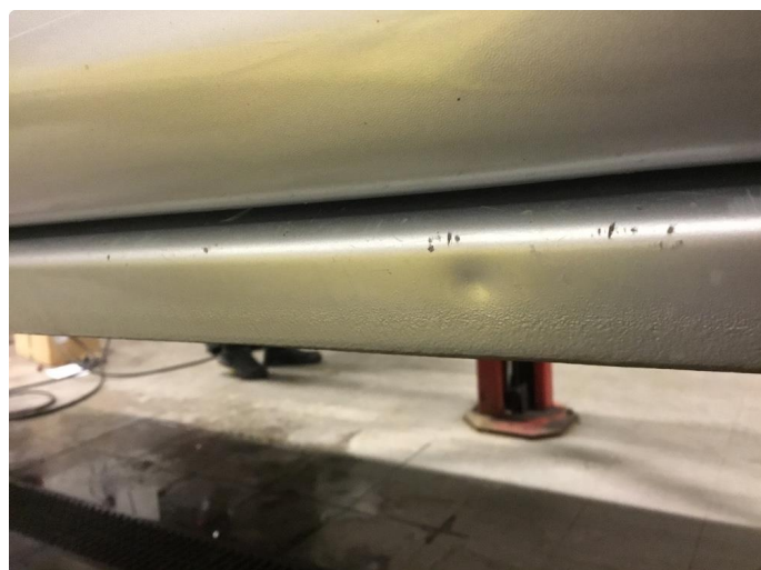
1.1 Generelt mye riper og småbulker