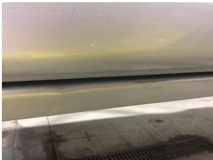
1.1 Generelt mye riper og småbulker