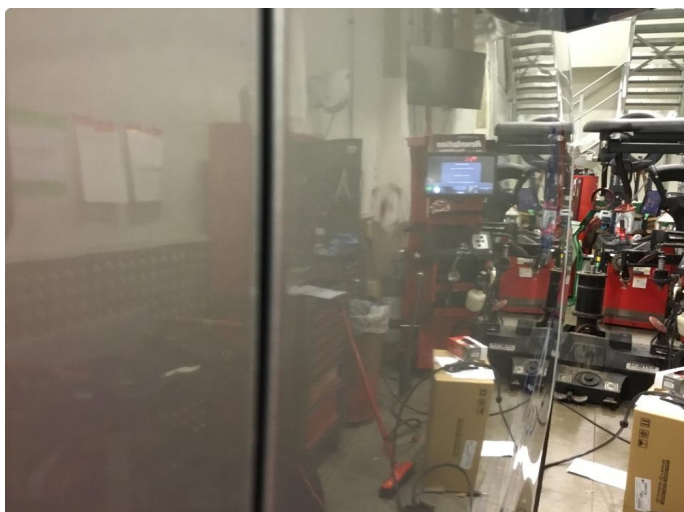
1.1 Generelt mye riper og småbulker