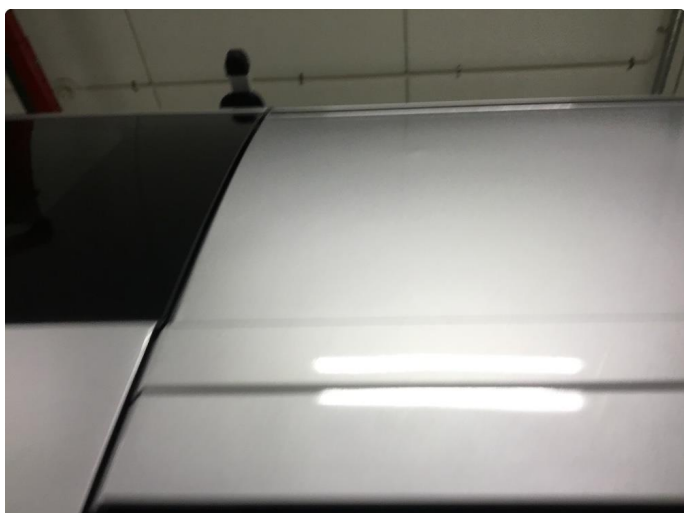
1.1 Generelt mye riper og småbulker