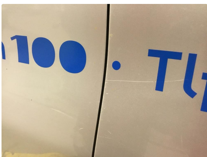
1.1 Generelt mye riper og småbulker