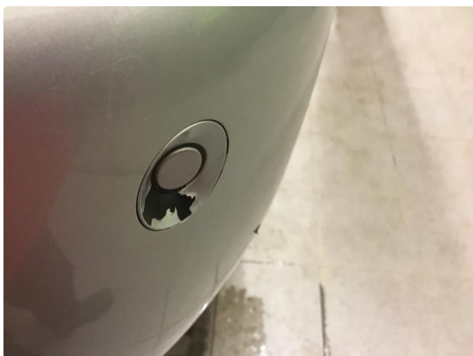
1.2 Lakk flasser