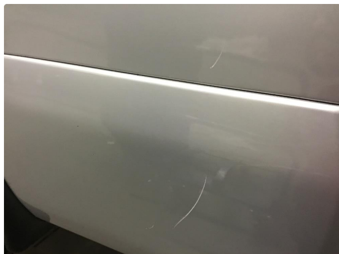
1.1 Generelt mye riper og småbulker