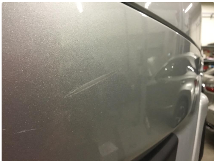
1.1 Generelt mye riper og småbulker