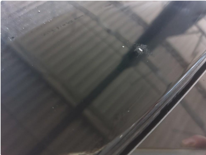
1.1 Steinsprut med rust