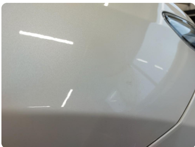
1.2 Ripe(r) ned til grunning Riper gjennom lakk og dårlig lakkering i ettertid på både skjerm og støtfanger HSF.