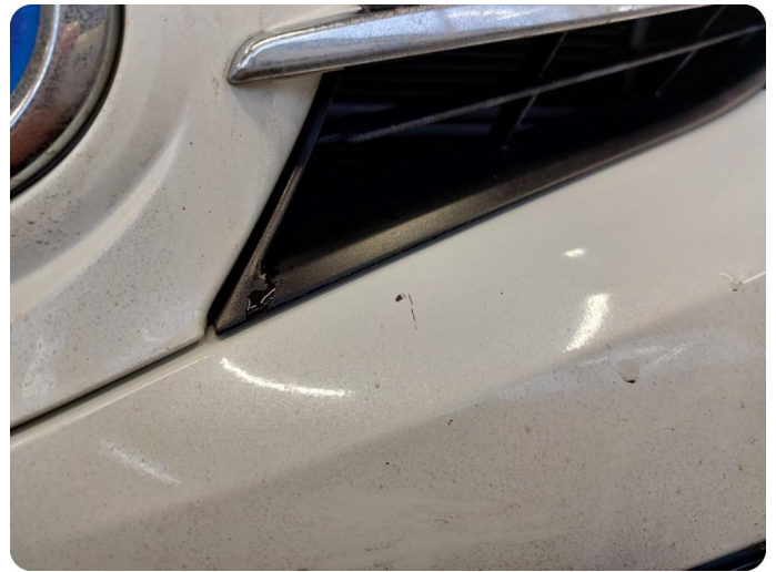
1.2 Ripe(r) ned til grunning Riper gjennom lakk og dårlig lakkering i ettertid på både skjerm og støtfanger HSF.