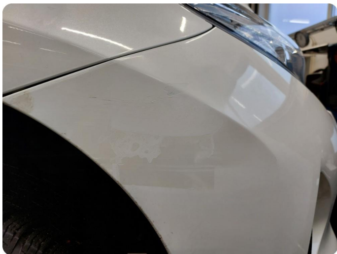
1.2 Ripe(r) ned til grunning Riper gjennom lakk og dårlig lakkering i ettertid på både skjerm og støtfanger HSF.