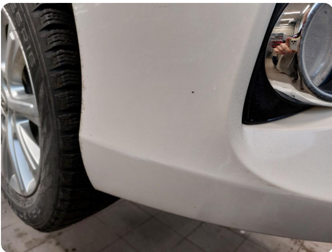
1.2 Ripe(r) ned til grunning Riper gjennom lakk og dårlig lakkering i ettertid på både skjerm og støtfanger HSF.