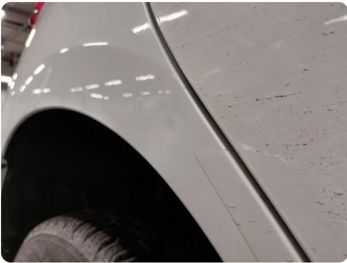
1.1 Bulk Liten bulk på skjerm HSB.