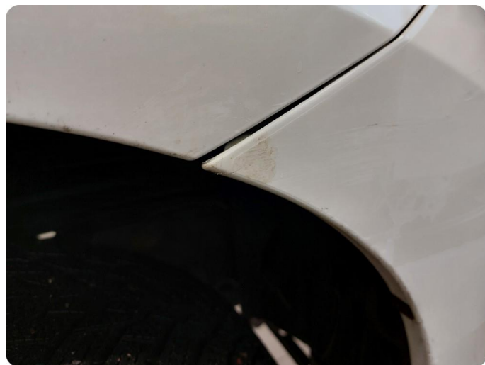
1.2 Ripe(r) ned til grunning Riper gjennom lakk og dårlig lakkering i ettertid på både skjerm og støtfanger HSF.