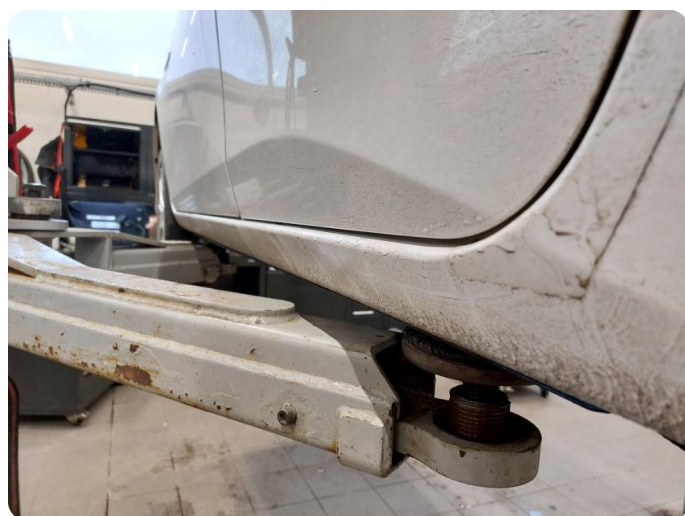
1.3 Bulk Kanalen er bulket / bøyd litt innover VSB.