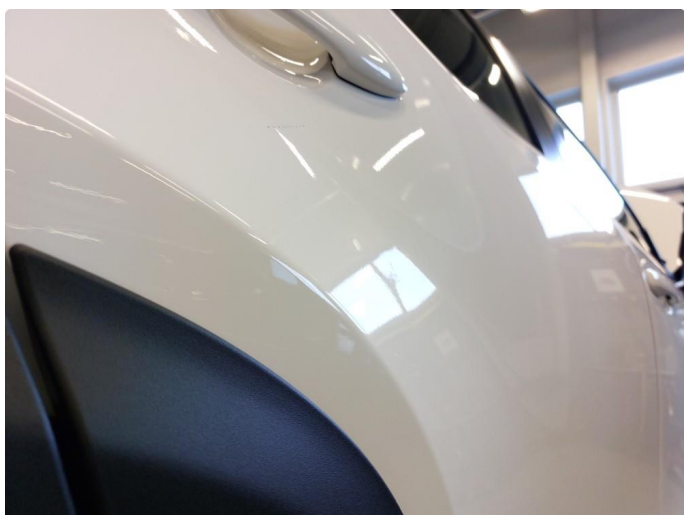
1.2 Liten bulk