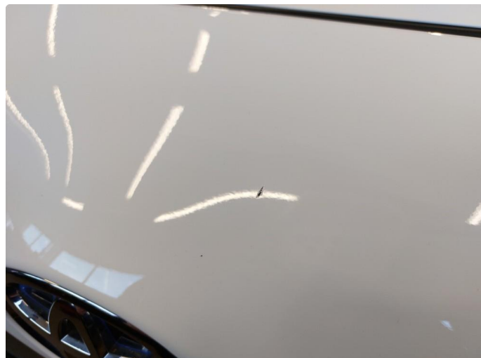
1.1 To små stensprut