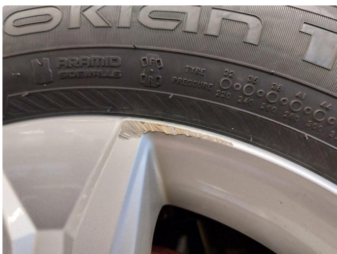
1.2 Skade på felg