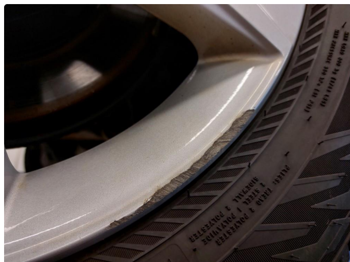
1.2 Skade på felg