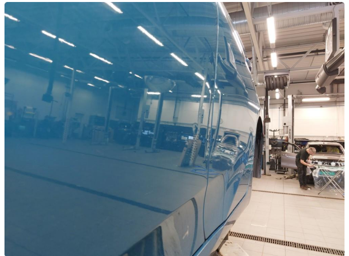
1.1 Liten bulk