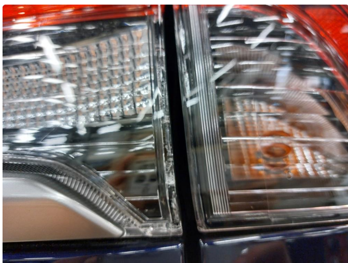
2.1 Krakelering i plast