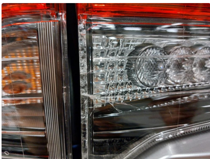
2.1 Krakelering i plast