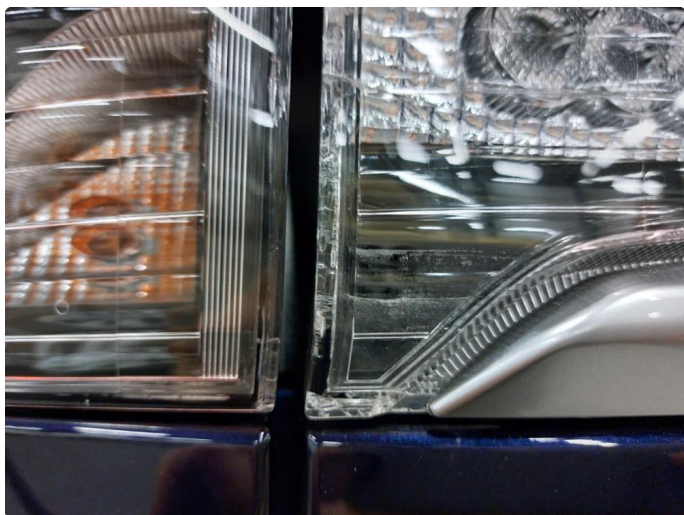
2.1 Krakelering i plast