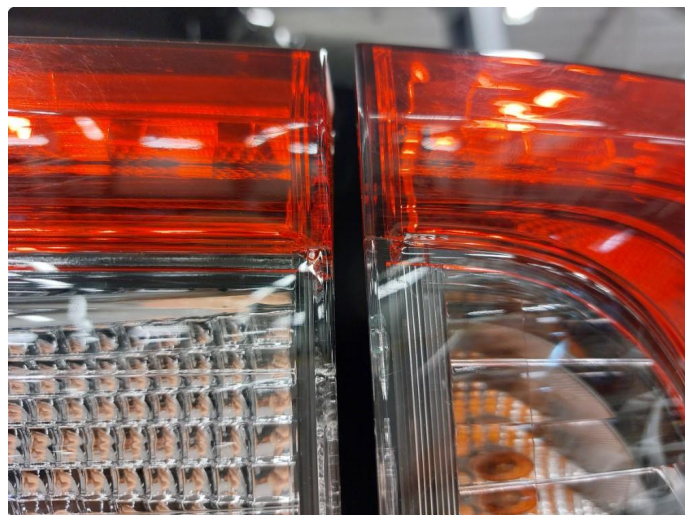
2.1 Krakelering i plast