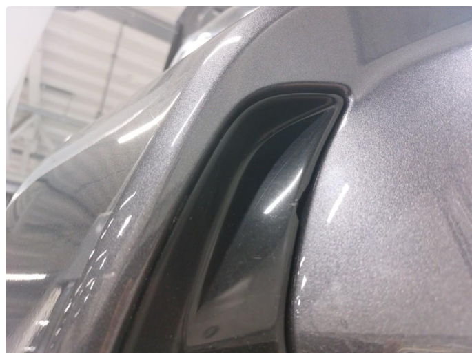
1.3 Liten skade på deksel