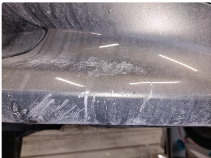
1.1 Skrubbskader underkant