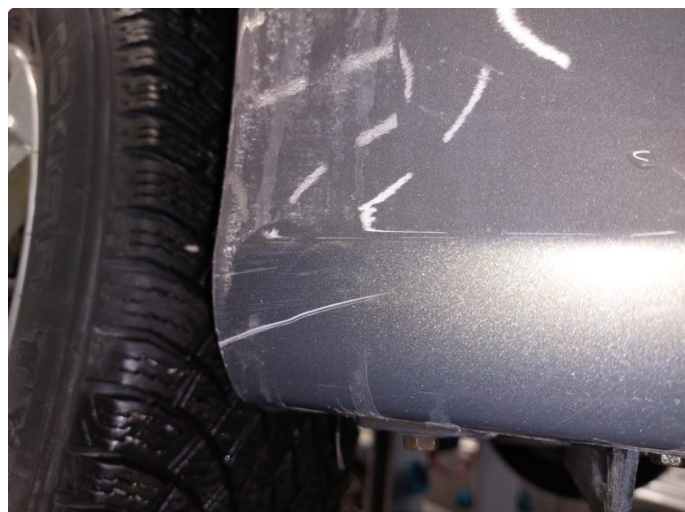
1.1 Skrubbskader underkant