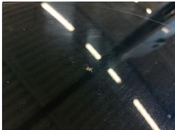
1.1 Steinsprut med rust