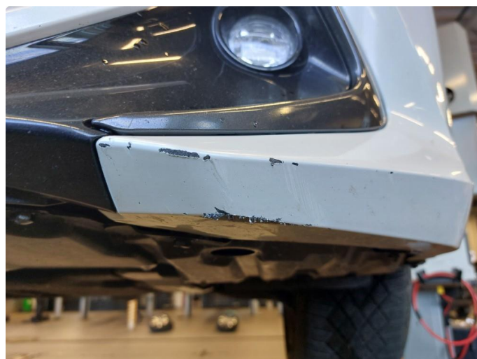
1.2 Skrubbskader underkant