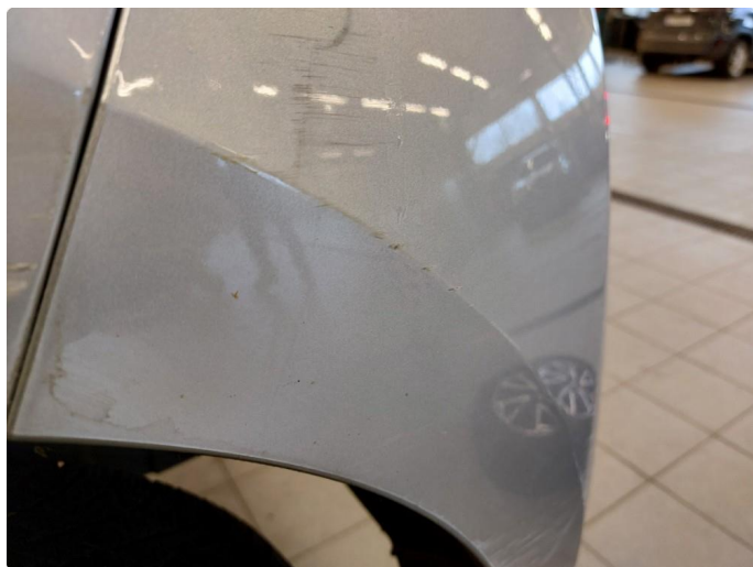
1.4 Bulk med lakkskade