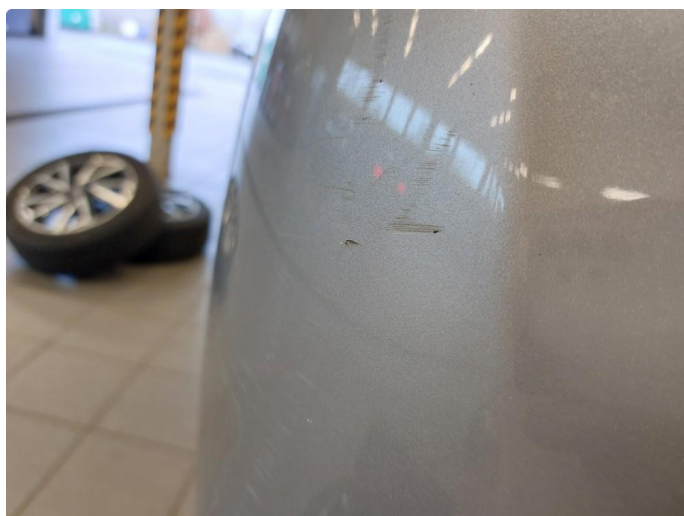
1.4 Bulk med lakkskade