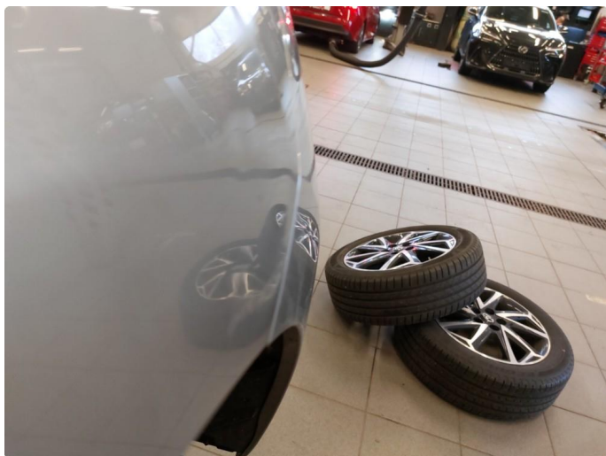
1.4 Bulk med lakkskade