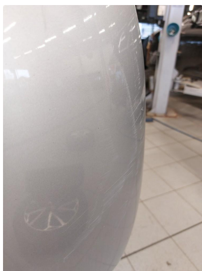
1.4 Bulk med lakkskade