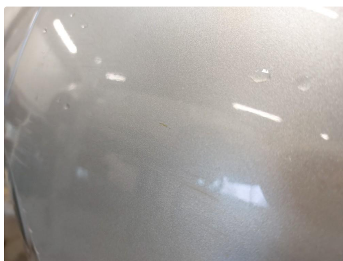
1.4 Bulk med lakkskade