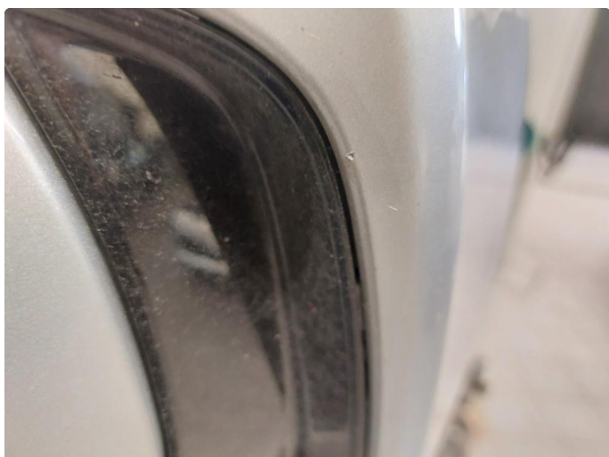
1.1 Generelt mye stensprut