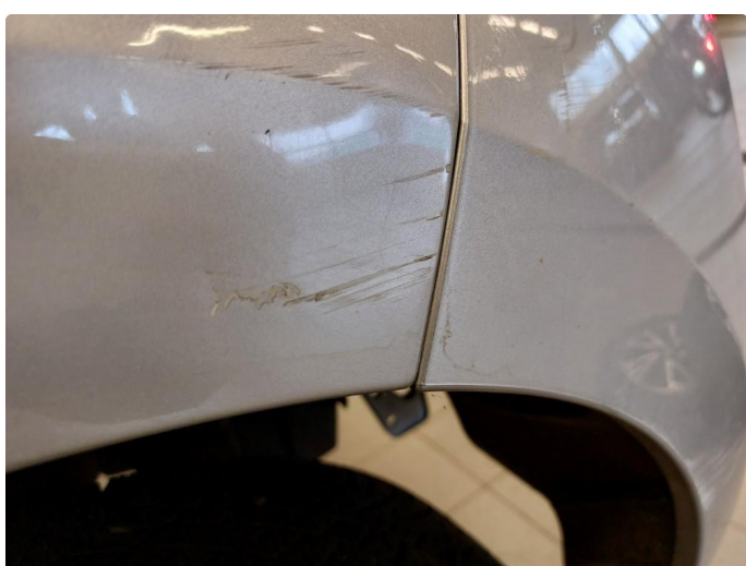
1.3 Bulk med lakkskade