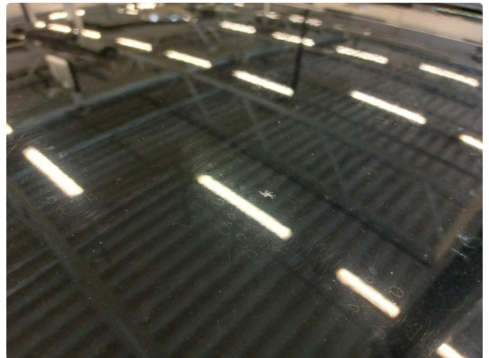
1.2 Steinsprut med rust