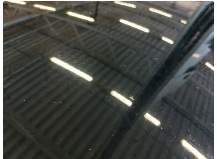
1.2 Steinsprut med rust