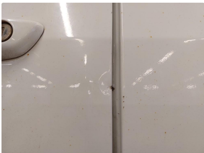
1.2 Bulk med lakkskade