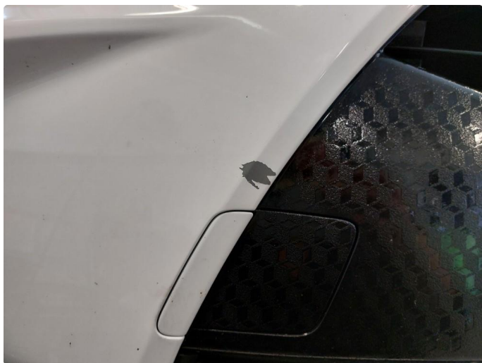
1.4 Liten lakkskade