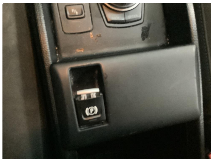
2.1 Bryter skadet