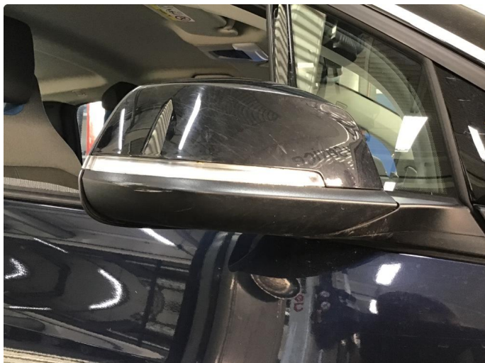
1.3 Speilhus riper