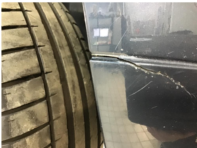
1.1 Skadet Støtfanger