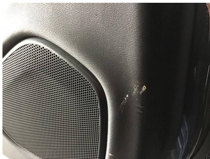
2.1 Liten skade