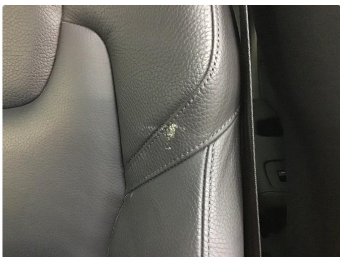
2.2 Liten skade på setetrekk