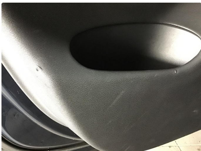
2.1 Liten skade