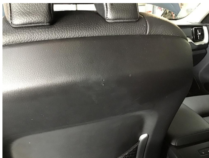
2.3 Noe slitasje på bakside seterygg