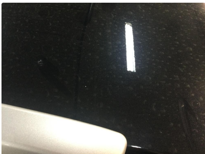
1.2 Steinsprut med noe rust