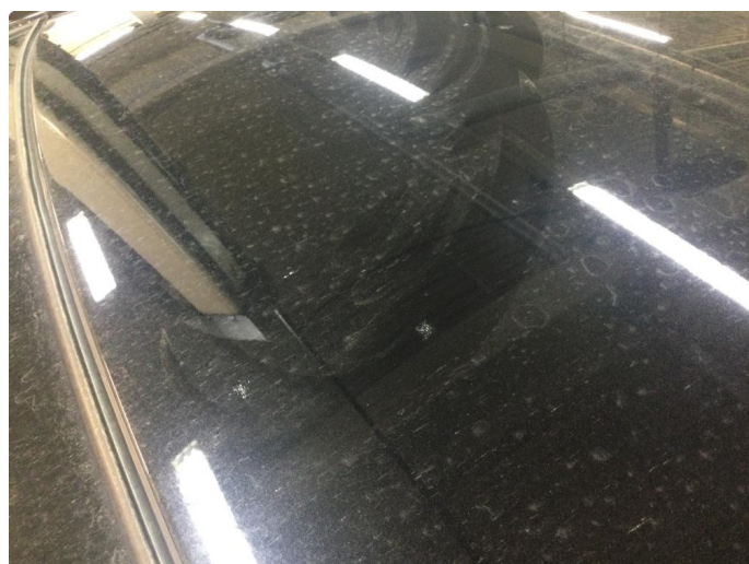
1.2 Steinsprut med noe rust