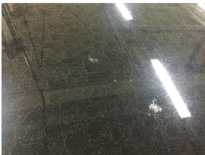
1.2 Steinsprut med noe rust