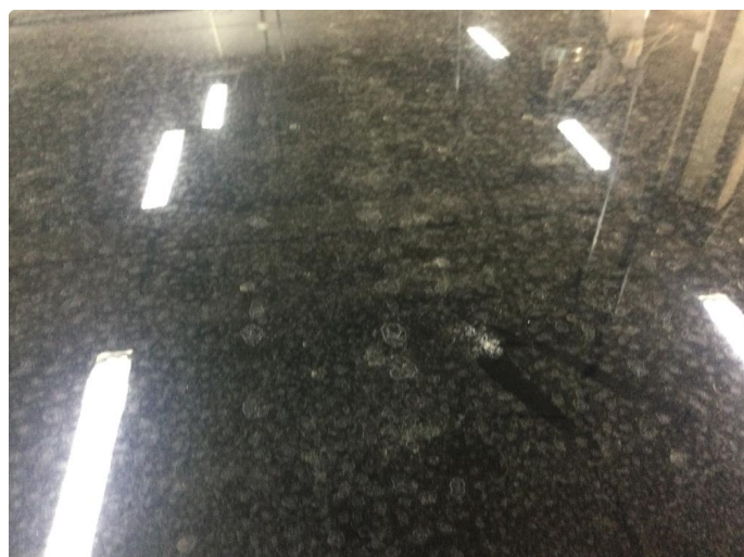
1.2 Steinsprut med noe rust