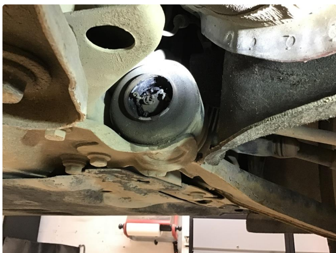
2.1 Noe svetting bakre bæreforing høyre foran