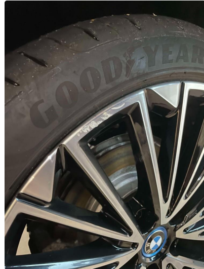
1.2 Skade på felg