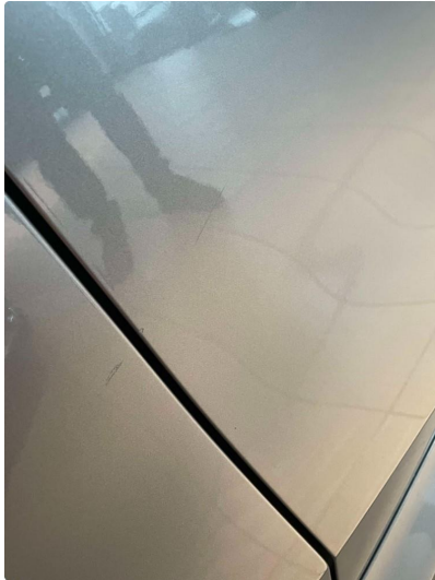
1.1 Ripe ned til grunning