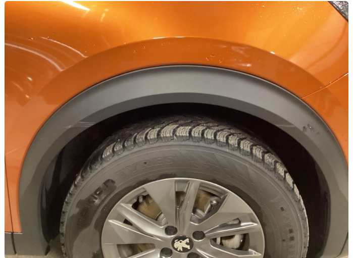
1.3 List mangler/skadet