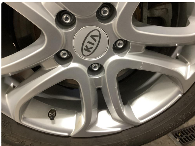
1.1 Skade på felg