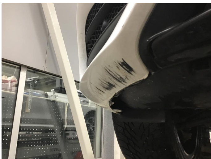
1.3 Skrubbskader underkant