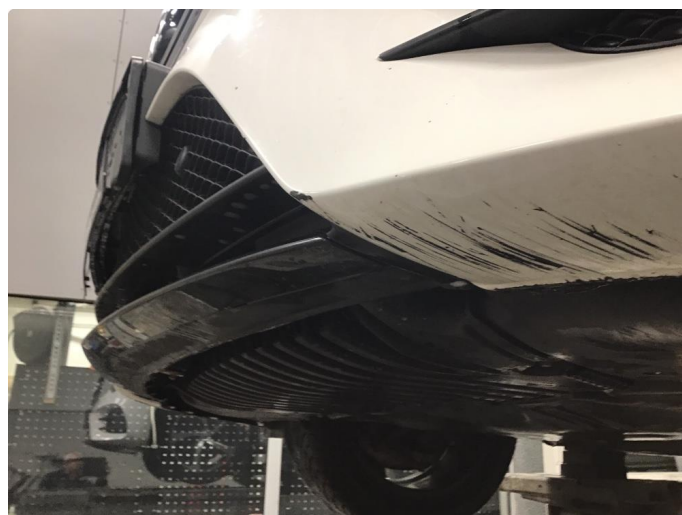
1.3 Skrubbskader underkant