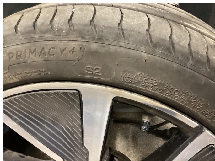
1.2 Skade på felg