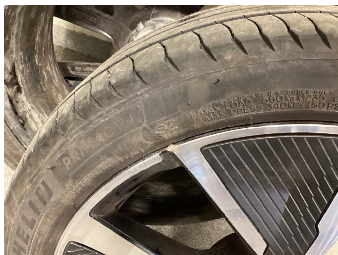
1.2 Skade på felg