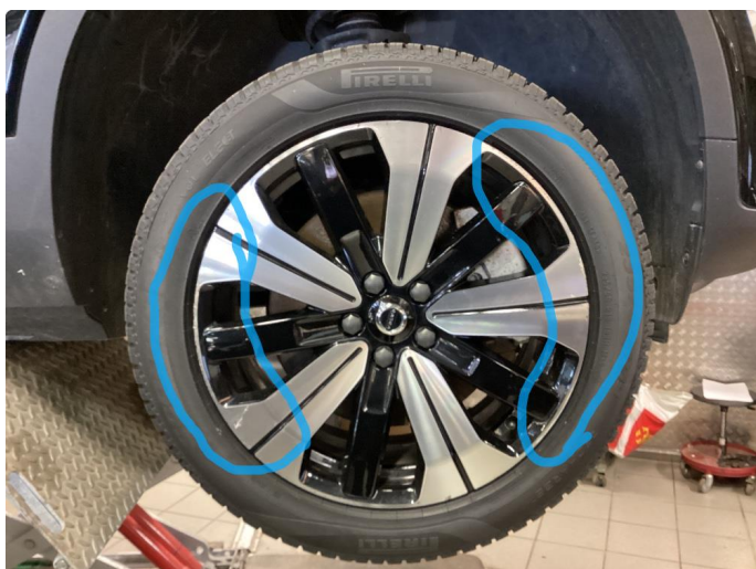
1.1 Kantkjørt felg Diamond Cut