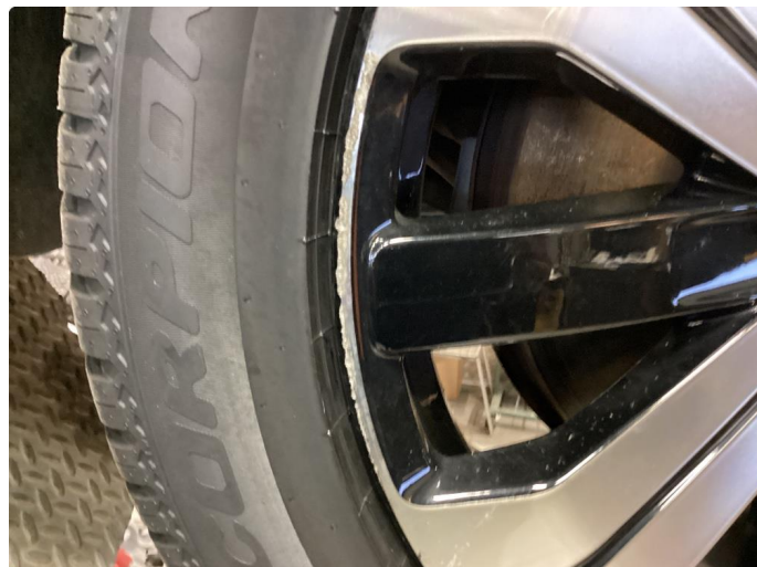
1.1 Kantkjørt felg Diamond Cut