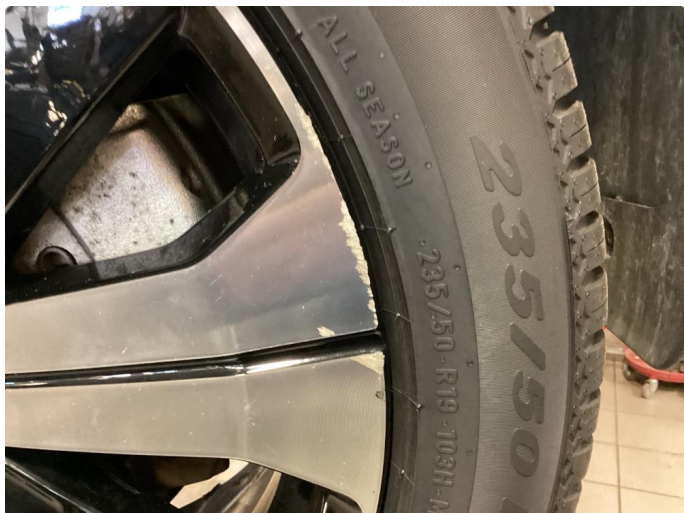
1.1 Kantkjørt felg Diamond Cut