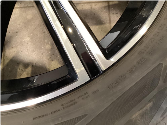
1.1 Skade på felg