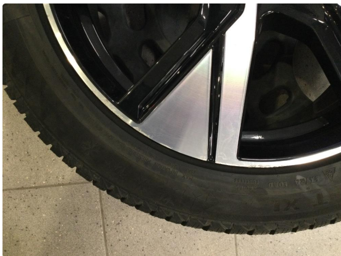
1.4 Kantkjørt felg