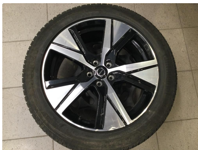
1.4 Kantkjørt felg