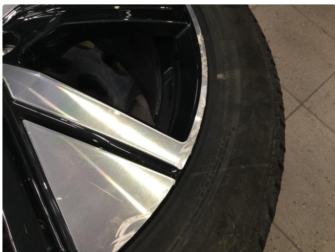
1.4 Kantkjørt felg