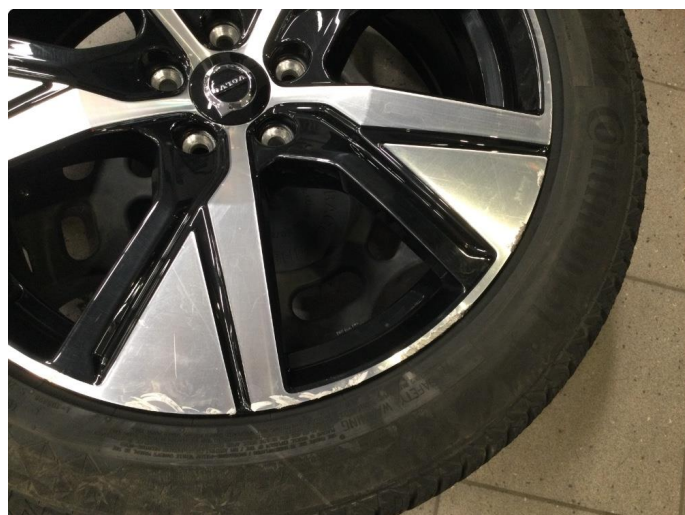
1.4 Kantkjørt felg