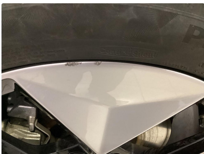
1.4 Kantkjørt felg