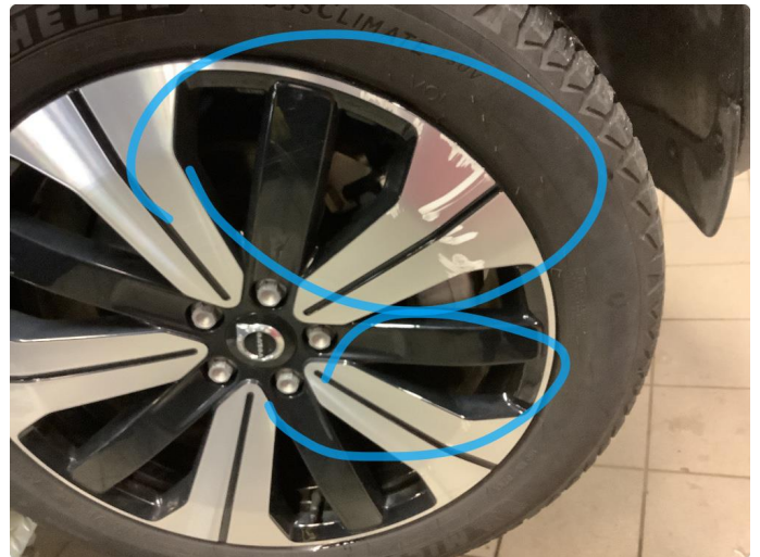
1.1 Kantkjørt felg Diamond Cut