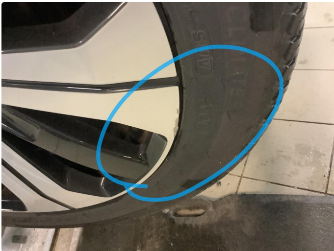
1.1 Kantkjørt felg Diamond Cut