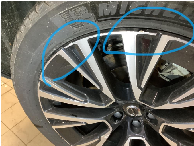
1.1 Kantkjørt felg Diamond Cut