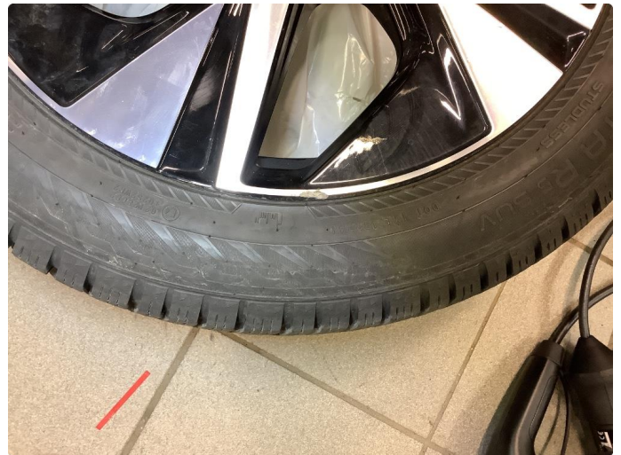
1.2 Kantkjørt felg Diamond Cut