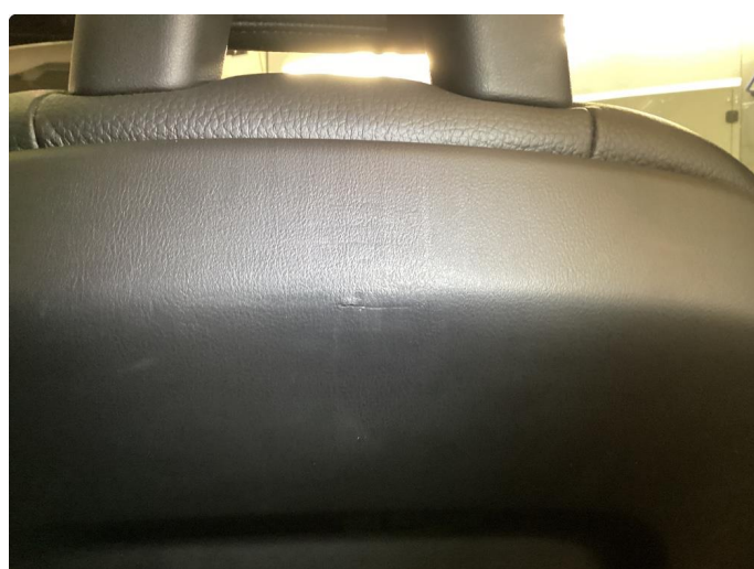
2.2 Skade på seterygg