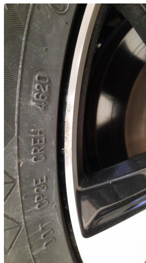
1.2 Kantkjørt felg